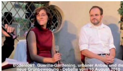
Bodenlos? Guerilla-Gardening, urbaner Anbau und die neue Grünbewegung - Debatte vom 10. August 2010 Klima Herbst 5.Okt Ausschnitte 1