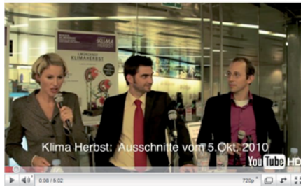
Energie am 05. Oktober im Marienplatz-Zwischengeschoss vor dem SWM-Shop