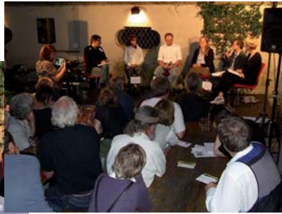
Landnutzung und Naturhaushalt am 10. August im Muffat-Café